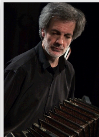
Hector Ulises Passarella zählt zu den berühmtesten Bandoneon-Spielern